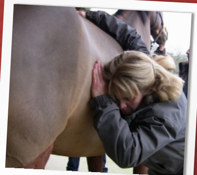
MISE EN SITUATION